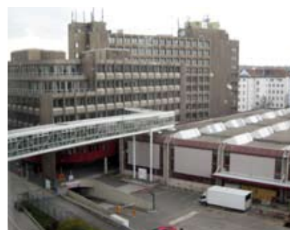
DIE NEUE UNTERNEHMENSZENTRALE, VORMALS SIEMENS

Bis zu sechs MitarbeiterInnen sollen in den neuen Büros untergebracht werden. Nahezu 100 Büros sollen auf diese Weise ausgestattet werden. Der Zentralausschuss, der Personalausschuss und die örtlich zuständigen Vertrauenspersonenausschüsse wehren sich gemeinsam gegen diese unwürdigen Zustände.